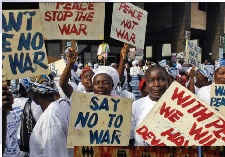
Międzynarodowy Dzień Kobiet w Liberii, 8 marca 2007 r.

Art. 1 Do celów niniejszej Deklaracji, pojęcie „przemoc wobec kobiet” oznacza każdy akt przemocy na tle płci, który powoduje lub może spowodować, fizyczną, seksualną lub psychiczną krzywdę lub cierpienie, w tym zagrożenie takimi czynami, stosowanie przymusu lub nieuzasadnione pozbawienie wolności, bez względu na to czy występuje w sferze publicznej, czy w życiu prywatnym.