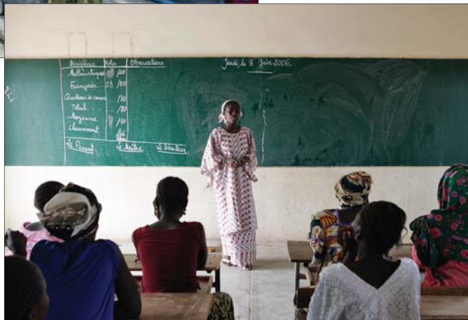
Wiejska szkoła dla kobiet, Senegal, czerwiec 2006 r.