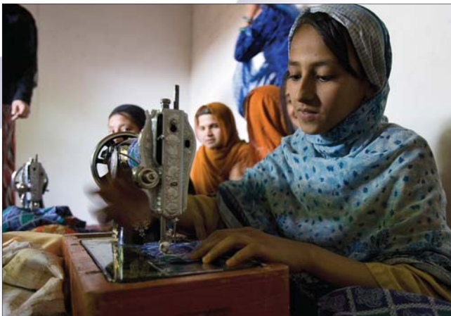
Afganistan, maj 2006 r.