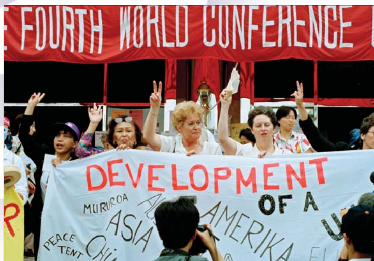
Czwarta Światowa Konferencja w sprawach Kobiet, Pekin, 3 września 1995 r.

O siągnięcie rzeczywistej równości wymaga skutecznego prawa o równym traktowaniu i zakazującego dyskryminacji z powodu płci. Konieczne są także strategie i plany, popularyzowanie i upowszechnianie dobrych praktyk oraz stałe monitorowanie sytuacji kobiet. W rezultacie tych działań poprawia się sytuacja kobiet na świecie, wzrasta rozumienie ich dążeń i praw. Chociaż dotąd w żadnym państwie świata i w żadnej dziedzinie życia nie osiągnięto pełnej równości kobiet i mężczyzn, to bez wątpienia równe prawa i równe szanse dla kobiet i mężczyzn oznaczają w istocie postęp dla wszystkich ludzi.