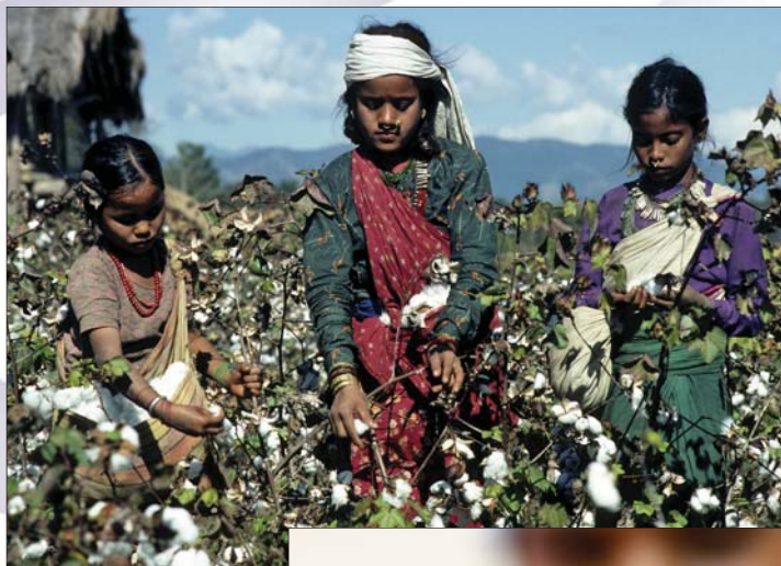
Plantacja bawełny, Nepal, 1978 r.

Art. 2.1 Każde Państwo Członkowskie powinno popierać, poprzez właściwe metody ustalania stawek wynagrodzeń, promowanie i, o ile jest to zgodne z tymi metodami, zapewniać stosowanie do wszystkich pracowników zasady jednakowego wynagrodzenia dla mężczyzn i kobiet za pracę o jednakowej wartości.