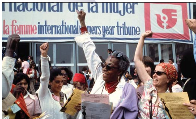
Światowa konferencja poświęcona Międzynarodowemu Roku Kobiet, Meksyk, 19 czerwca 1975 r.

Konferencja zajmowała się przede wszystkim zatrudnieniem, zdrowiem i edukacją kobiet. Dokonała przeglądu i oceny postępu osiągniętego w pierwszej połowie Dekady Kobiet. Przyjęła Program Działania na Drugą Połowę Dekady Kobiet: „Równość, Rozwój i Pokój” , w którym skupiono się na wypracowaniu międzynarodowych strategii mających na celu podniesienie statusu kobiet. Konferencja podkreśliła, że należy nie tylko dążyć do eliminacji dyskryminacji prawnej, ale również do umożliwienia kobietom udziału w rozwoju, zapewniając im pełne uczestnictwo i uwzględniając ich potrzeby.