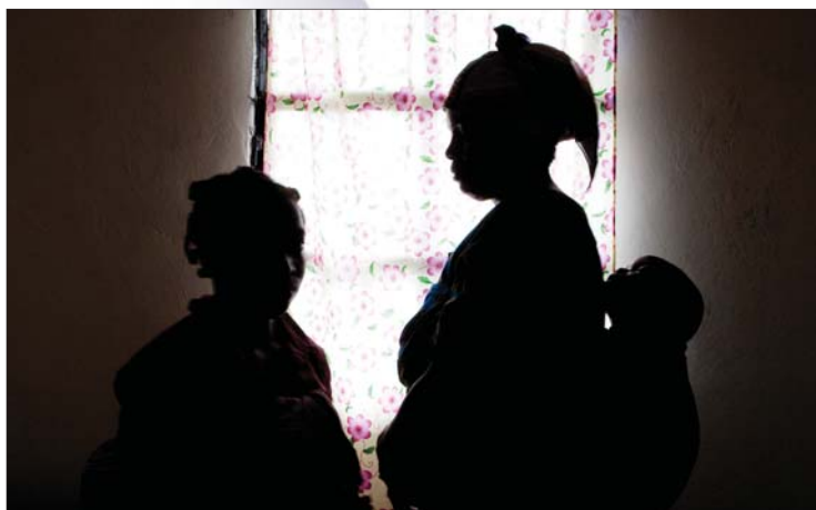
Ofiary przemocy seksualnej, Demokratyczna Republika Konga, marzec 2009 r.