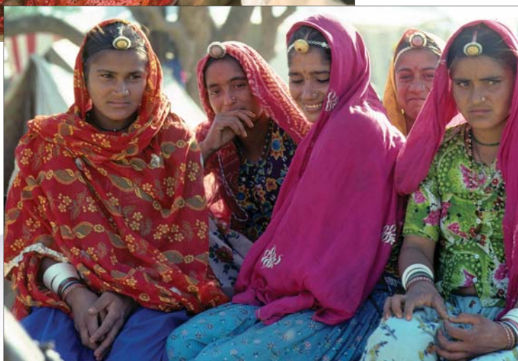
Indie, 1983 r.