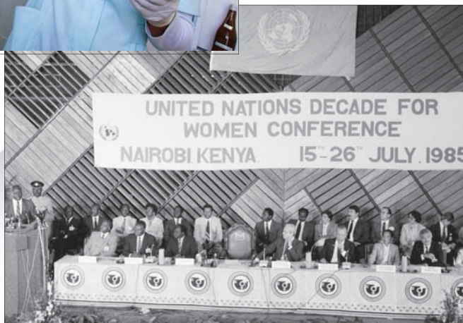
Światowa konferencja przeglądowa oceniająca osiągnięcia Dekady Kobiet, Nairobi, 15 lipca 1985 r.