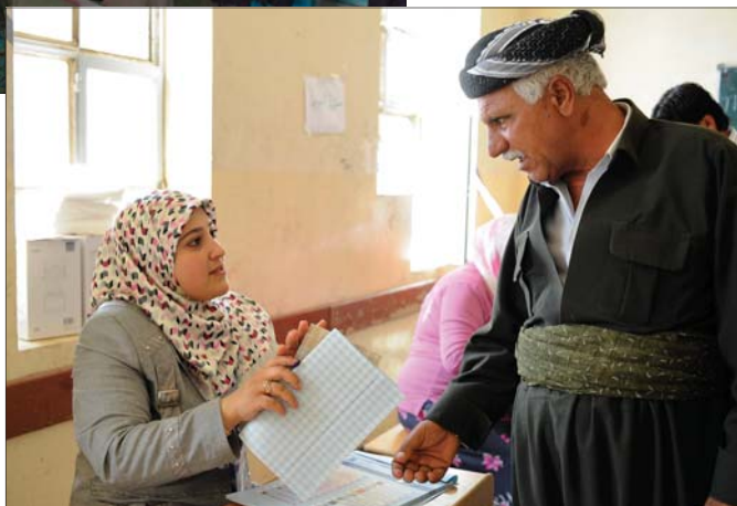
Wybory w regionie Kurdystanu, Irak, lipiec 2009 r.