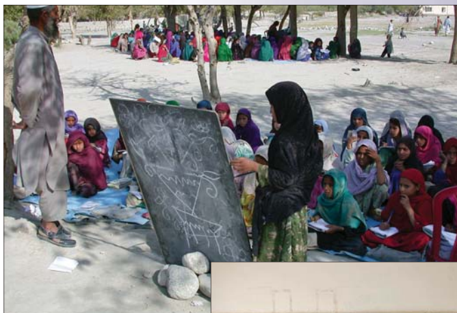
Afganistan, czerwiec 2008 r.

Art. 2 Dla celów niniejszej Konwencji, określenie „edukacja” obejmuje wszystkie rodzaje i poziomy kształcenia i obejmuje dostęp do edukacji, poziomu i jakości wykształcenia i warunków jej udzielania.