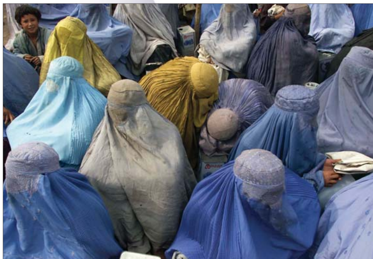
Obóz uchodźców w Pakistanie, marzec 2001 r.