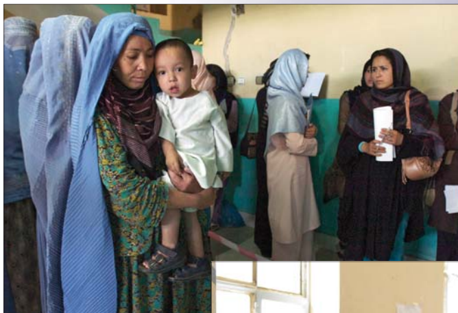
Wybory w Afganistanie, sierpień 2009 r.

Art. 3 Kobiety są uprawnione na równych warunkach z mężczyznami bez żadnej dyskryminacji do piastowania urzędów publicznych i do wykonywania wszelkich funkcji publicznych, przewidzianych w ustawodawstwie krajowym.