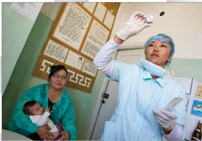
Klinika w Mongolii, lipiec 2009 r.

Konferencja podsumowująca osiągnięcia Dekady Kobiet przyjęła dokument końcowy Strategie Długoterminowe na rzecz Podniesienia Statusu Kobiet . Strategie zakładają przyspieszenie zmian legislacyjnych i politycznych w większym stopniu uwzględniających prawa kobiet, działania na rzecz pełnego i równego udziału kobiet we wszystkich sferach życia społecznego, w tym również w polityce i w procesach decyzyjnych. Za zagadnienia szczególnej wagi uznano: politykę zatrudniania kobiet; zdrowie, świadczenia socjalne i edukację; równy dostęp do działalności gospodarczej oraz zasobów finansowych i kredytów; ubóstwo kobiet wiejskich; rolę mediów w zwalczaniu stereotypowego wizerunku kobiet i szerszy dostęp kobiet do informacji; sytuację kobiet z rejonów konfliktów zbrojnych i doświadczających przemocy; kobiet jedynek rodziny; kobiet niepełnosprawnych fizycznie lub psychicznie. Strategie zawierają wskazówki dotyczące wdrażania podstawowych założeń na szczeblu krajowym, tak by pomóc państwom w przygotowaniu i wdrażaniu programów i polityk dotyczących równości. Strategie z Nairobi postulują współpracę regionalną i międzynarodową w kwestii podniesienia statusu kobiet i ich włączenia w procesy rozwoju i budowania pokoju.