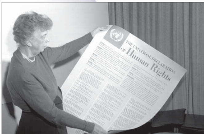
Eleanor Roosevelt, Nowy Jork, 1 listopada 1949 r.

Art. 2 Każdy człowiek posiada wszystkie prawa i wolności zawarte w niniejszej Deklaracji bez względu na jakiekolwiek różnice rasy, koloru, płci, języka, wyznania, poglądów politycznych i innych, narodowości, pochodzenia społecznego, majątku, urodzenia lub jakiegokolwiek innego stanu.