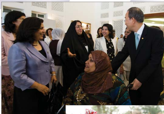
Spotkanie Sekretarza Generalnego ONZ z przedstawicielkami Rady Najwyższej Kobiet, Bahrajn, maj 2009 r.

Art. 4 Wprowadzenie przez Państwa Strony tymczasowych zarządzeń szczególnych, zmierzających do przyspieszenia faktycznej równości mężczyzn i kobiet, nie będzie uważane za akt dyskryminacji w rozumieniu niniejszej konwencji, jednakże nie może w żaden sposób pociągać za sobą utrzymania nierównych lub odrębnych norm; zarządzenia te powinny być uchylone z chwilą osiągnięcia celów w zakresie równości szans i traktowania. Wprowadzenie przez Państwa Strony specjalnych zarządzeń, w tym również zarządzeń przewidzianych w niniejszej konwencji, w celu ochrony macierzyństwa nie będzie uważane za akt dyskryminacji.