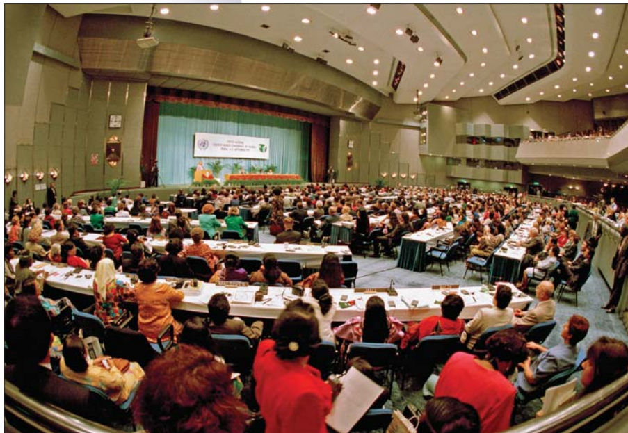
Czwarta Światowa Konferencja w sprawach Kobiet, Pekin, 5 września 1995 r.

Konferencja w Pekinie była największym spotkaniem w sprawach kobiet poświęconym dyskryminacji, równości i uwłasnowolnieniu (empowering) kobiet w skali globalnej, regionalnej i w każdym państwie. Dokument końcowy Konferencji Platforma Działania ustala 12 obszarów kluczowych dla walki z dyskryminacją kobiet. Platforma Działania wzywa rządy do tworzenia krajowych programów działań w celu upowszechnienia równego traktowania kobiet i mężczyzn przez wprowadzenie zmian legislacyjnych, równość na rynku pracy, w rodzinie, w życiu politycznym i społecznym. Działania mają podjąć także instytucje międzynarodowe, organizacje pozarządowe i sektor prywatny. Platforma Działania postuluje zwiększenie dostępu kobiet i dziewcząt do edukacji i zmniejszenie analfabetyzmu wśród kobiet i dziewcząt; doskonalenie opieki medycznej dla kobiet; upowszechnianie informacji na temat metod planowania rodziny; likwidowanie biedy wśród kobiet i zapobieganie ich marginalizacji społecznej; podejmowanie działań na rzecz eliminacji przemocy wśród kobiet; zwiększanie udziału kobiet w polityce i procesie podejmowania decyzji na szczeblu lokalnym, krajowym i międzynarodowym. Konferencja w Pekinie i Platforma Działania przewidują włączanie perspektywy płci (gender mainstreaming) do wszystkich polityk i strategii państwa.