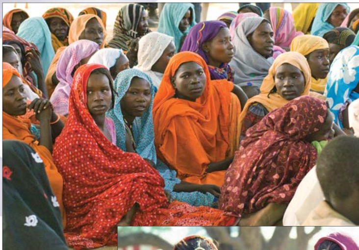
Czad, listopad 2008 r.

Art. 1 Małżeństwo nie może być prawnie zawarte bez pełnej i swobodnej zgody obu stron; zgoda ta powinna być przez nie wyrażona osobiście, po należytych podaniu do wiadomości publicznej i w obecności właściwej władzy, przed którą małżeństwo ma być zawarte, oraz świadków, zgodnie z przepisami prawa.