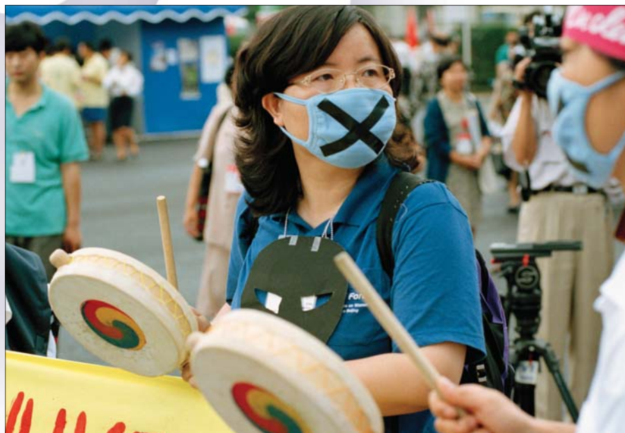
Czwarta Światowa Konferencja w sprawach Kobiet, Pekin, 3 września 1995 r.

Przemoc wobec kobiet w jej wszystkich aspektach i przejawach stanowi największą barierę na drodze do osiągnięcia równości i postępu. Podkreśla to światowa kampania na rzecz przeciwdziałania przemocy wobec kobiet pod hasłem: „ Zjednoczmy się aby wyeliminować przemoc wobec kobiet ”, ogłoszona przez Sekretarza Generalnego ONZ Ban Ki-moona na lata 2008-2015.