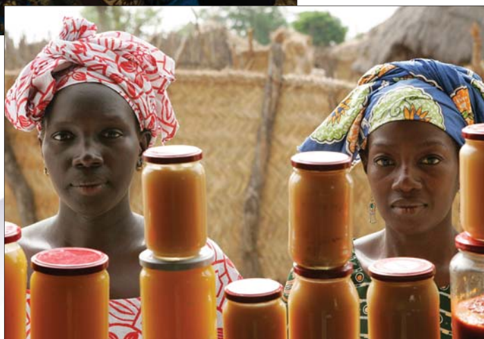
Kobiety sprzedające konfitury z mango, Senegal, czerwiec 2006 r