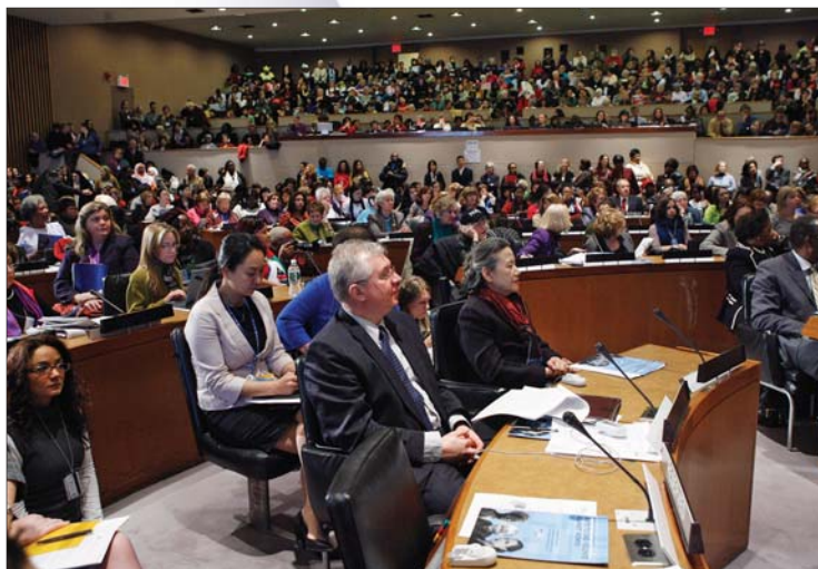
Obchody Międzynarodowego Dnia Kobiet, Komisja ds. Statusu Kobiet, Nowy Jork, 5 marca 2009 r.

(Deklaracja o eliminacji przemocy wobec kobiet)