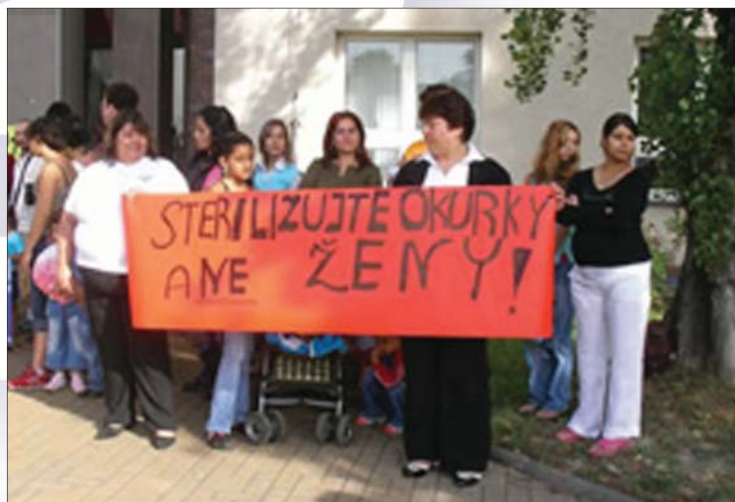
Kobiety pochodzenia romskiego protestujące przeciw wymuszonej sterylizacji, Czechy, 2006 r.

Art. 1 W rozumieniu niniejszej konwencji określenie „dyskryminacja kobiet” oznacza wszelkie różnicowanie, wyłączenie lub ograniczenie ze względu na płeć, które powoduje lub ma na celu uszczuplenie albo uniemożliwienie kobietom, niezależnie od ich stanu cywilnego, przyznania, realizacji bądź korzystania na równi z mężczyznami z praw człowieka oraz podstawowych wolności w dziedzinach życia politycznego, gospodarczego, społecznego, kulturalnego, obywatelskiego i innych.